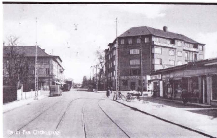
Bælti fra Ordrupvej

Den flotte bank-bygning på hjørnet af Ordrupvej og Banevej er opført af Handelsbanken til formålet og på tegningerne kan man se en flot bankboks i kælderen med dobbelte mure og lige noget for Olsen-banden. På de første tegninger arbejdede man med at bevare den store flotte villa der lå på grunden. Man ville bygge en randbebyggelse udenom villaen, således at det ville ligne det vi har i dag, men med den oprindelige villa beliggende i gården som "indmad" til huset. Det blev ikke til noget.