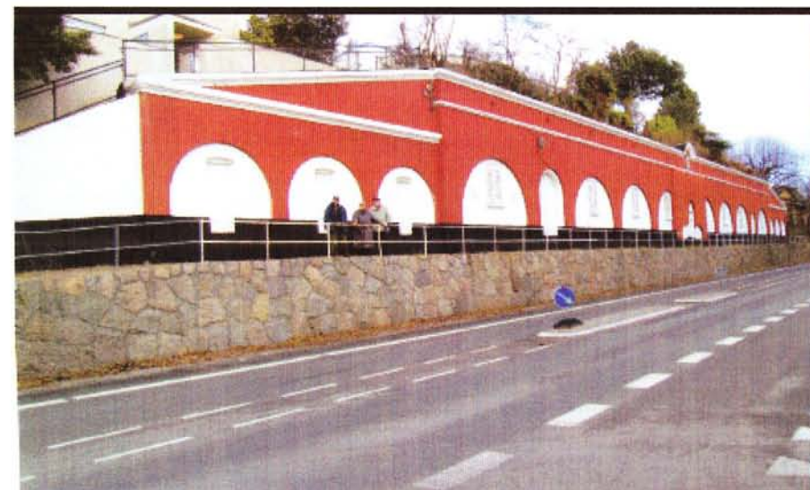
Ordrup fort som det ser ud i dag.