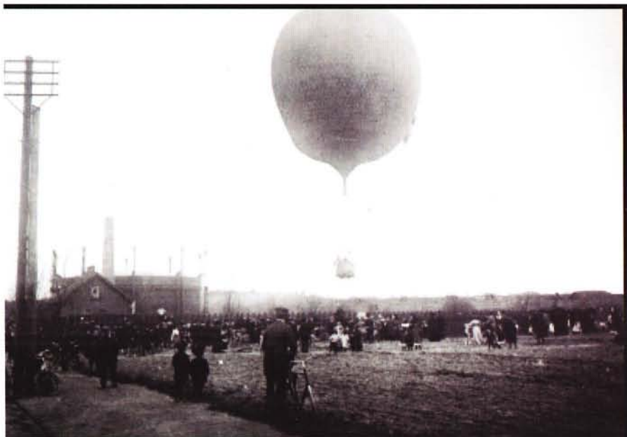
Ballonopstigning på Clarasvej i Ordrup.

I takt med gassens stigende succes blev det i 1900 nødvendigt at opføre en gasbeholder i den nordlige del af kommunen for at holde trykket i gasledningsnettet oppe. Valget faldt på en mark på nuværende Clarasvej og her lå, indtil for ikke så mange år siden, den nu nedrevne gasbeholder.