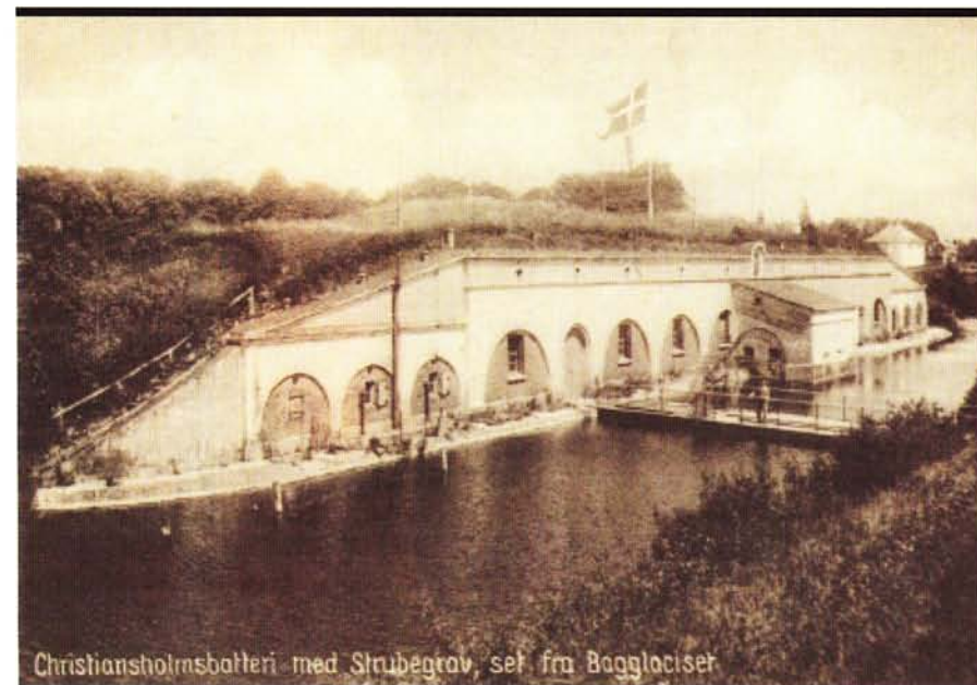
Ordrup fort ses her på et tidspunkt mellem 1924 og 1932.

Fortet, der i folkemunde blev kaldt "Bananfortet", fordi det i en periode efter verdenskrigen blev anvendt til opbevaring og langsom modning af bananer – var skyld i at Ordrupvejs oprindelige vejføring blev forlagt. Man ville have Ordrupvej uden om det hemmelige militære område, og da man samtidig gravede en vandfyldt kanal – nu Hvidørevej – som Ordrupvej skulle krydse, så var det nemmere at lave en lige bro end en skrå. Derfor slår Emiliekildevej ligeledes idag nogle gevaldige knæk på hver side af broen over Hvidørevej.