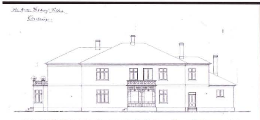
Den originale tegning af grosserer Wetlings villa på Ordrupvej 154. Bemærk skorstenene, der sidenhen er fjernet i takt med udbygningen.

Det er den gamle villa i midten med det skrå tag.